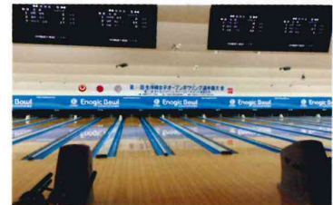
The bowling alley is equipped with 36 lanes. 36レーンを備えたボウリング場