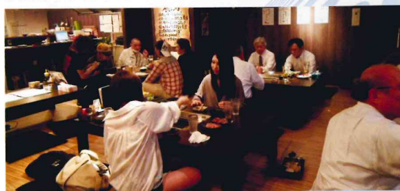
40人がゆったりくつろげる店内

を期待して2012年2月に導入。スープ、ミソ汁、ダシ、炊飯、アルコールを割る水、食材洗浄などに還元水をフル活用し効果を上げている。また、油使用の多い店内だけに、とくに油脂分除去に強還元水は役に立っているという。