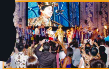
2014 Enagic Global Convention