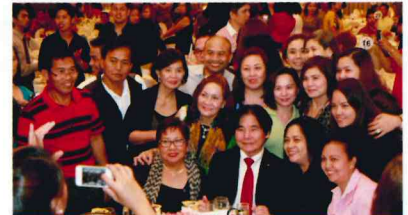
Many requested pictures with the CEO – a familiar scene at our events 大城会長と一緒に写真撮影を望む人たち—おなじみの光景だ