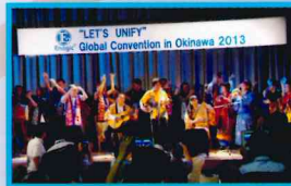
2013 Enagic Global Convention