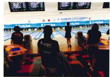
Enagic Club member who competed in the “All Jpan Club” Bowling Championship. 全日本クラブ対抗選手権に出場したエナジッククラブの選手

Enagic Bowl, Inc. (Enagic Bowl Mihama) 9-8 Mihama, Chatan-Cho Nakagami-Gun, Okinawa 904-0115 Phone: 098-926-3939