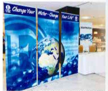
The impressive banner near the reception area 受付付近に設えた印象的なバナー