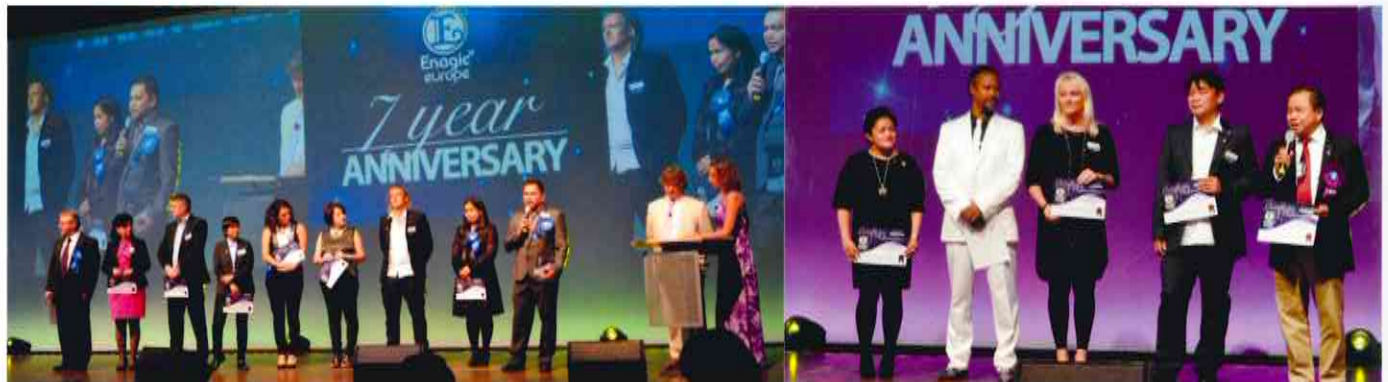
New 6A (left) and 6A2 distributors received their certificates. 認定証を授与された新 6 A (左) と新 6 A2 の販売店