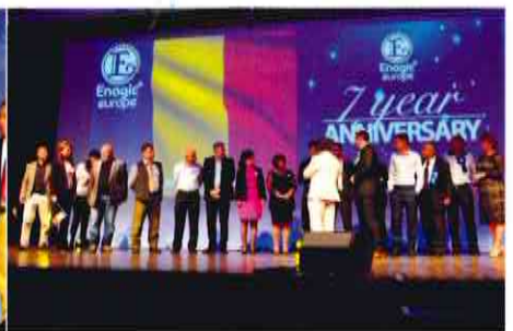
(From left) Distributors from England, France, Romania, were introduced on stage. 壇上で紹介される(左から)イギリス、フランス、ルーマニアの販売店