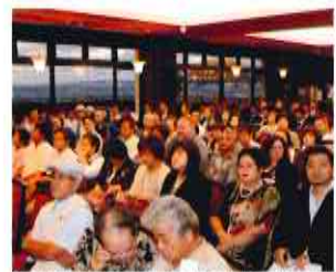
Around 200 people rushed to the launch party. 約200名が詰めかけた出版記念会