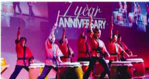
A powerful performance was given by the local Japanese drum team. 場内に響き渡った現地和太鼓チームの力強い演奏

Adding to the excitement of the ceremony, vibrant and rhythmic sounds vertebrated through the halls as a local Japanese drum team gave their dynamic performance of an impressive fusion of Japanese and Western cultures.