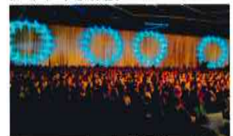
The venue overflowed with 2,000 participants. 2,000人で埋め尽くされた会場