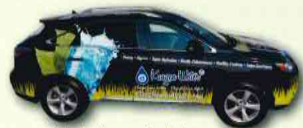
A daring Kangen Car design. 斬新なデザインのKangen車(カー)