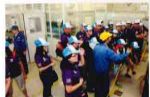
Everyone attentively observes the assembly of parts. 組み立て部門を熱心に見学